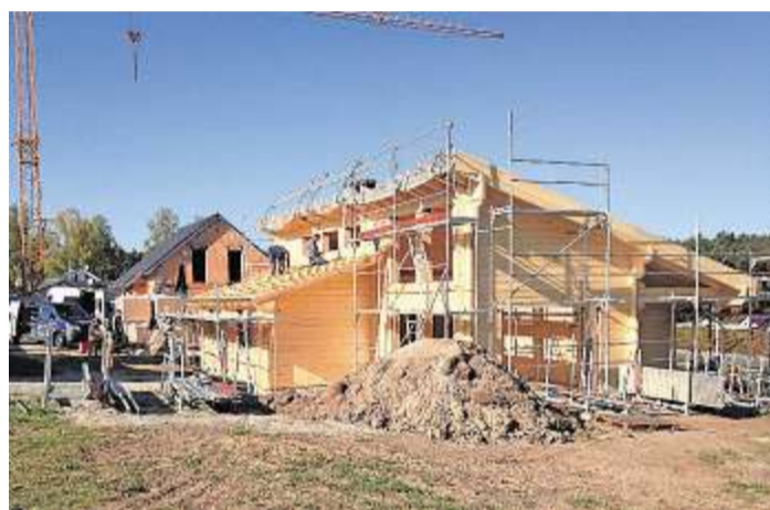
Wie auch im ersten Bauabschnitt erwartet Bauwillige eine große Vielfalt und Individualität. Die offene Bauweise lässt jede Menge Gestaltungsraum.

→ Eine Übersicht über die noch freien Bauplätze sowie weitere Informationen erhält man auf www.mjk-immobilien.de