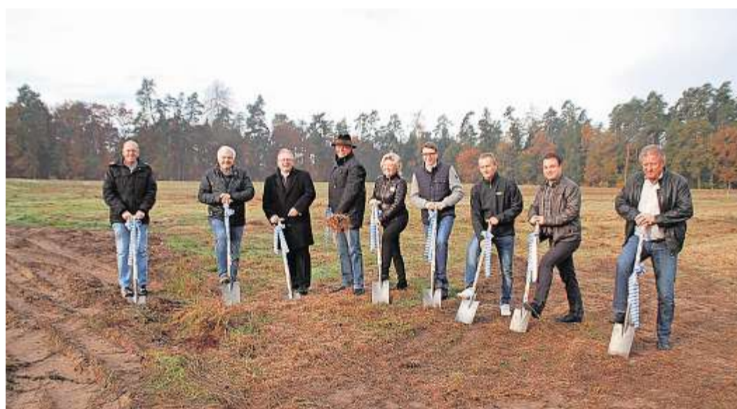
Familie Kraus von der Firma mjk Projektentwicklung sowie Vertreter der Gemeinde und der bauausführenden Firmen beim ersten Spatenstich für das Baugebiet Klaus-Ludwigsheide

Das große Interesse an den Grundstücken zeige, dass die